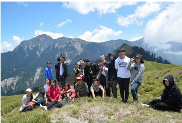
於合歡山進行環境課程

池南自然教育中心提供高中生的方案為「島嶼奏鳴曲」及客製化的「環境永續課程」。「島嶼奏鳴曲」以池南為基地，進行定向運動、復活島之歌、Home 影片欣賞及我的綠色行動等教育單元。「環境永續課程」則以高中班級的需求而量身設計，例如曾為花蓮海星高中策畫 2 天 1 夜的合歡山之旅，為桃園武陵高中策畫 3 天 2 夜的花蓮自然生態與人文之旅，讓學生們在山河大地中快樂地學習。