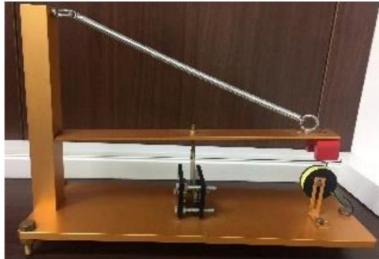
地震前兆園區與地震儀