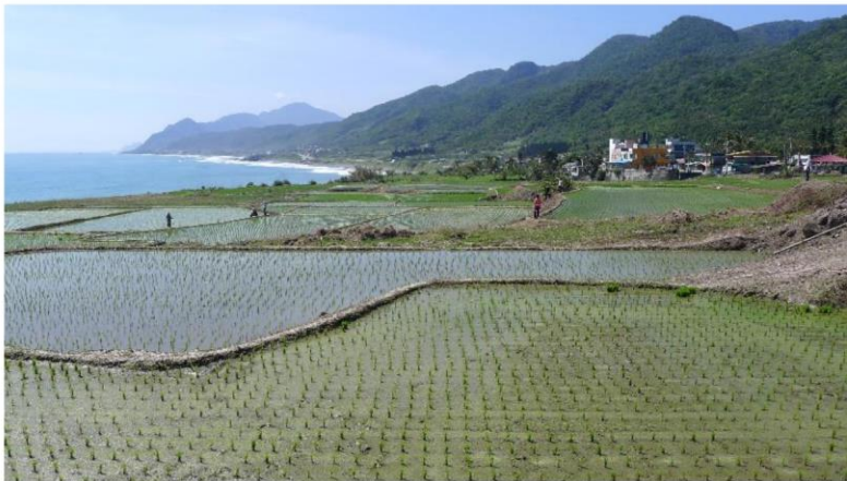
➤ 新社海階水梯田農業文化景觀