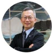
李蔡彥《與談主持人》 國立政治大學校長

李蔡彥校長，美國史丹佛大學機械系博士，研究專長為機器人學、電腦動畫、虛擬實境、人工智慧和互動敘事。曾任國立政治大學電子計算機中心主任、資訊科學系主任、教學發展中心主任、主任秘書、教育部資訊及科技教育司司長等職。民國 111 年當選校長，是政大首位科技人出身的校長。曾協助教育部推動前瞻基礎建設國中小數位校園計畫、大學程式設計等計畫，目前正主持教育部提升大學通識教育計畫，致力提升國內大學通識教育教學品質與跨域人才之培育。