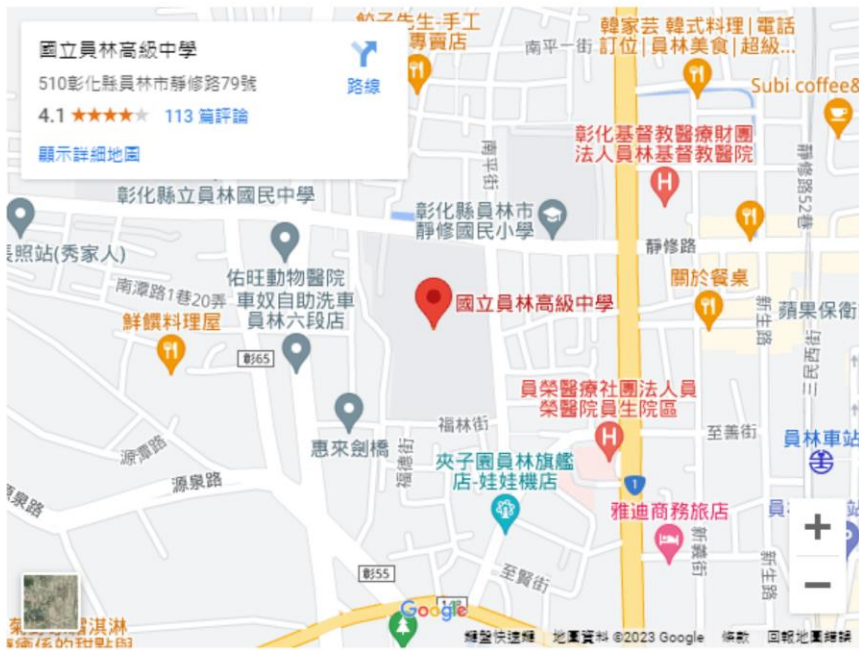
員林高中校園平面圖