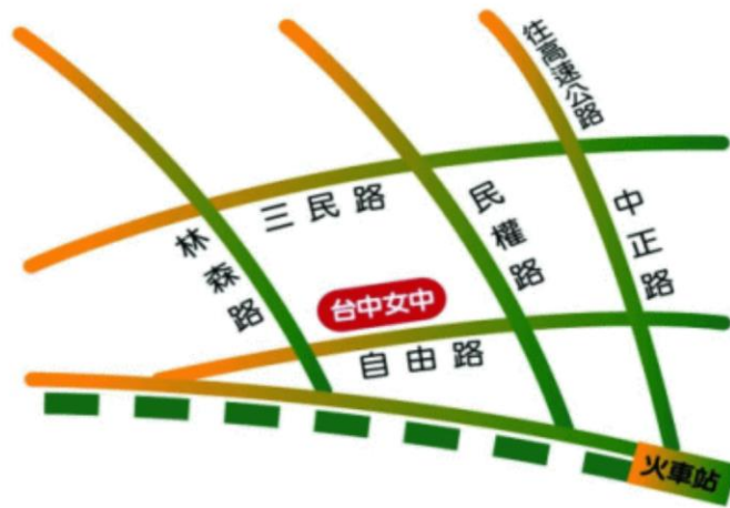
臺中市立臺中女子高級中等學校 110 學年度校園配置圖