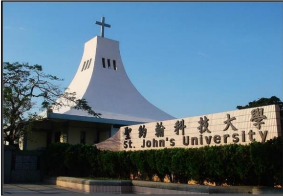
圖一：2024校務研究與永續發展研討會將於2024年6月6日舉辦