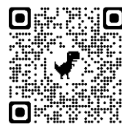
地科入門推廣研習宣傳影片