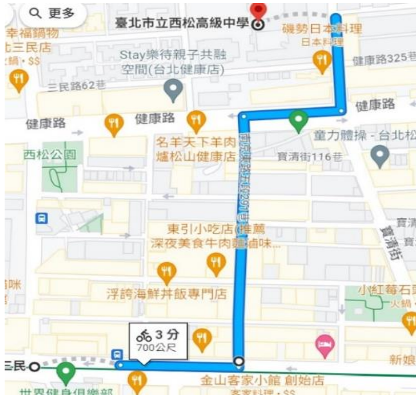
(南京三民捷運站4號出口 > 本校 路線指引圖)

三、火車搭乘資訊：【松山車站】轉乘捷運松山信義線【南京三民站】或公車八德路出口轉乘民生幹線(原518)、63、棕1路線公車，至發電所(西松高中)站。