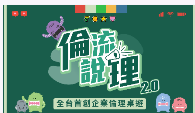
▲「倫流說理2.0」新版桌遊-影音介紹