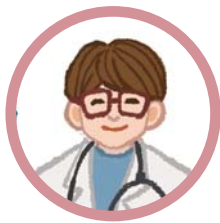
專家（司法詢問員、醫生、鑑定人等）

為被告辯護的辯護人，或是幫助你主張法律權利的告訴代理人，他們都是律師、都是法律專家。